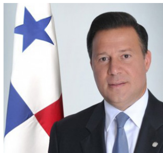
Juan Carlos Varela

Será anfitrión de la Cumbre de las Américas en abril