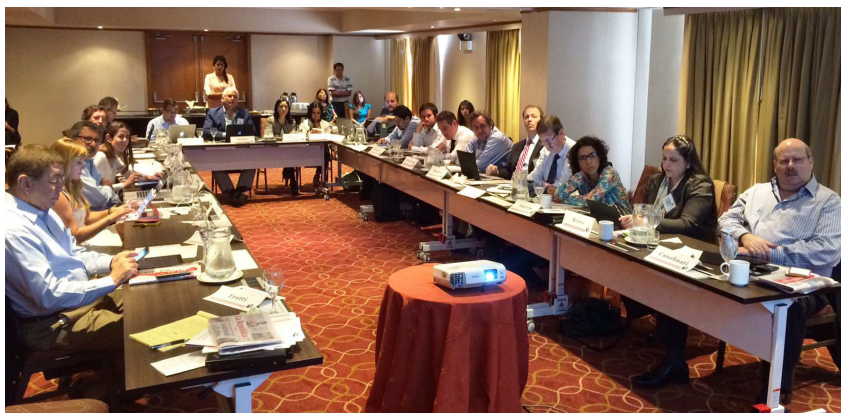
El foro convocado por la SIP durante una de sus sesiones en Lima.

Se revisaron las experiencias de organizaciones de prensa en Europa y Brasil en cuanto al uso de contenido por parte de los motores de búsqueda y agregadores del internet