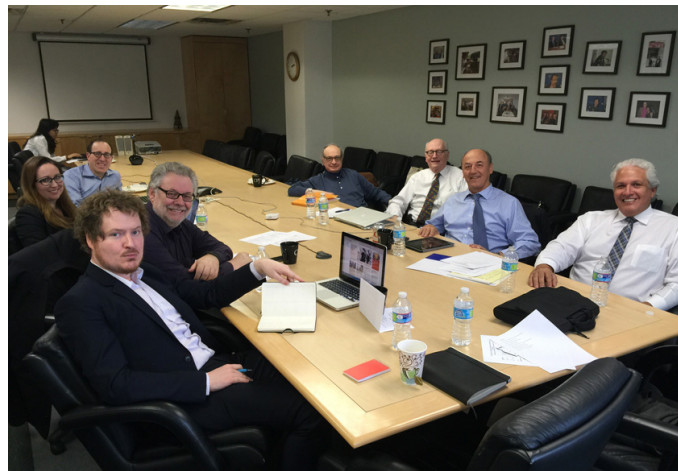
Los delegados del Comité Coordinador Mundial en la sede del CPJ.

Desde 1981 el Comité Coordinador se reúne dos veces al año, una en forma presencial en el mes de enero y otra por teleconferencia en junio. Fue constituido mediante una iniciativa de la SIP y su misión es analizar, dialogar y crear estrategias comunes sobre libertad de prensa. Lo integran: Comité de Protección de Periodistas (CPJ); Commonwealth Press