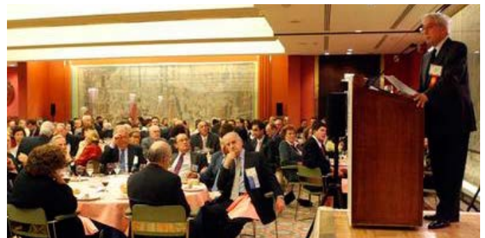
Vargas Llosa en 2008 pronunció un discurso ante la SIP en el que criticó la proliferación de la "prensa light".