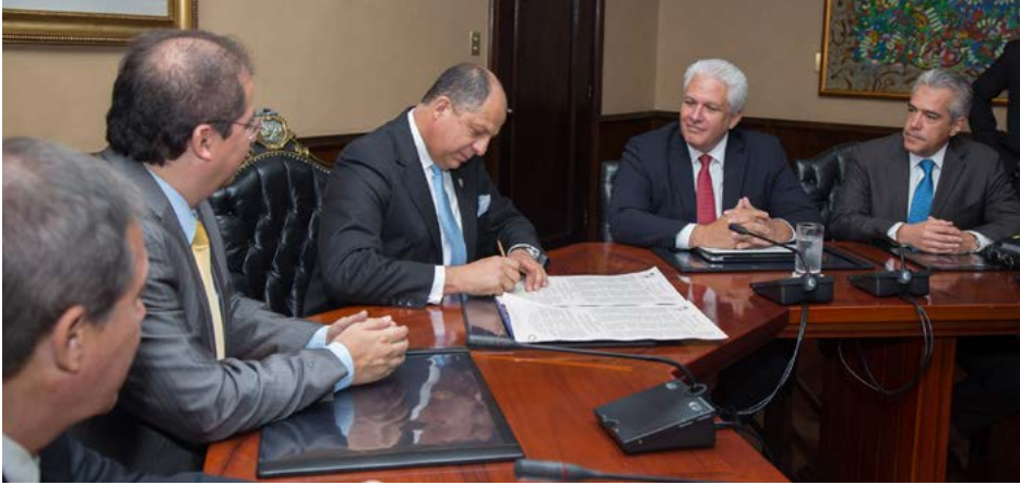
El mandatario costarricense al momento de la firma.