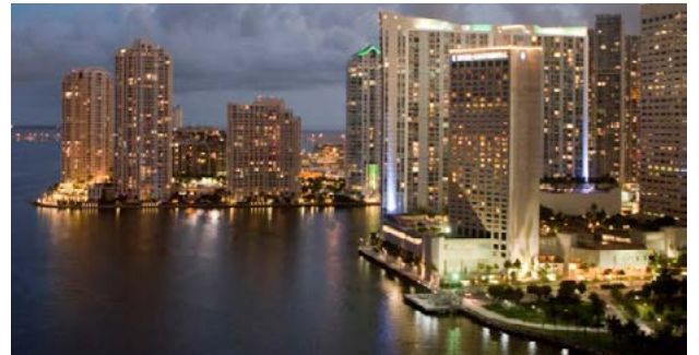
El Hotel Intercontinental Miami frente a la Bahía de Biscayne.

El objetivo de la conferencia es propiciar que las nuevas plataformas digitales sean una fuente segura de ingresos y generadoras de nuevas audiencias así como el desarrollo de redes y contactos entre medios de comunicación y empresas digitales en América Latina, el Caribe y Estados Unidos. Las dos primeras jornadas dedicadas a presentaciones, paneles y exposiciones