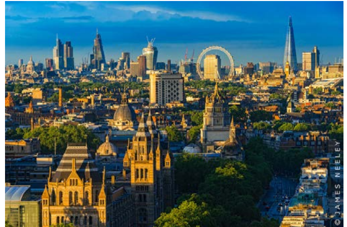
Charleston no es únicamente una ciudad museo, la nueva arquitectura estadounidense aun en el centro histórico la hace una de las más vibrantes metrópolis del sur.

En octubre Charleston es cálido. Las temperaturas diurnas son de 77-78° F (25-26° C). Las temperaturas nocturnas son de 66 - 67° F (18-19° C). ■