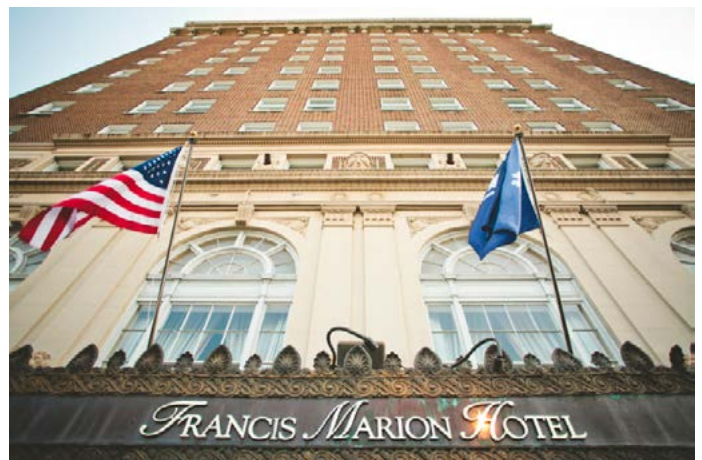
El sede de la 71ª Asamblea General es un hotel con una larga tradición que fue renovado recientemente como parte de un programa de preservación histórica.