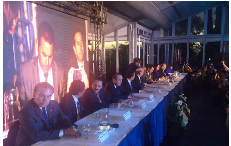
Los candidatos a la presidencia de Guatemala previo a los comicios en primera vuelta realizados el 6 de septiembre.

Baldizón es propietario de medios de comunicación en Guatemala y, tras su revés en las urnas, su partido se encuentra en crisis por la renuncia de 10 de sus diputados en el Congreso Nacional y la acusación por