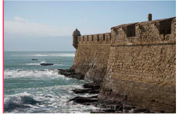
El Castillo de San Sebastián, frente a la Bahía de Cádiz.

este encuentro de la prensa en el corazón de Andalucía. La vice presidenta de gobierno de España, Soraya Sáenz de Santamaría , ha sido invitada a la inauguración oficial el 21 de abril en el Palacio de los Congresos en Cádiz igual que los Príncipes de Asturias para el acto de clausura el día 22. Más en páginas 2 y 3.