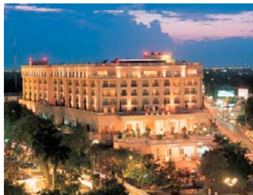
El hotel Gran Fiesta Americana de Mérida, Yucatán, sede de la 66ª Asamblea General de la SIP del 5 al 9 de noviembre.

La SIP vuelve a México, esta vez a la Ciudad Blanca de Mérida, para realizar su 66ª. Asamblea General. El "país amigo" que ha recibido a la institución en innumerables asambleas y reuniones de medio año, la última en Ciudad de México en septiembre-octubre del 2006, nuevamente abre sus puertas para invitar a los delegados de nuestra institución a Mérida, en el estado de Yucatán. La sede será el Hotel Fiesta Americana Mérida ubicado donde se unen las dos avenidas más importantes de la ciudad. Luego del cambio de sede, por