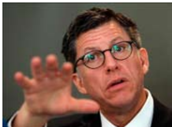
José Miguel Vivanco.

Vivanco, de nacionalidad chilena, afirmó en Oranjestad, Aruba, durante la reunión semestral de la SIP, que “un indicador clave para medir el progreso democrático en un determinado país es el nivel de protección que se le da a la libertad de expresión”. “Desde el año 2004 el sistema judicial de Venezuela es un apéndice del