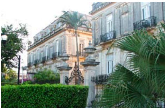
Residencias en el Paseo de Montejo en Mérida.

El programa incluirá seminarios, paneles, exposiciones centrales y figuras muy conocidas internacionalmente. Se puede adelantar que los paneles enfocarán temas de mucha relevancia en México como la violencia e impunidad que afecta principalmente la zona norte y estados fronterizos de México, y la respuesta que hasta ahora ha ofrecido el Estado. Habrá también mesas redondas sobre el problema del narcotráfico