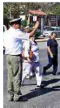
► Sólo 78 agentes están en las calles, tras la suspensión de la operación de Tránsito

Según dijeron las fuentes, ayer por la tarde cerca de 120 elementos, de un total de 894, fueron integrados en una lista a manera de acuerdo de intención con la memoria-