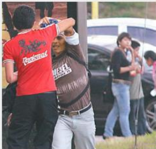
A plena luz: El ataque fue a las 5:30 p. m., frente a la redada del frente de transacción.