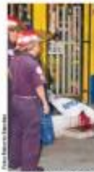
El "Nica" fue atendido a balazos en el pecho.