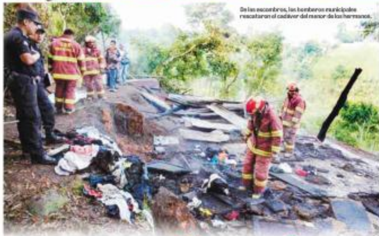
De las escombros, los bomberos municipales rescataron el cadáver del menor de los hermanos.