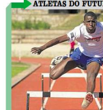
ATLETAS DO FUTURO

Campeões na vida Um grupo de jovens de Porto Alegre está se preparando para uma viagem de estudos e trabalho para o exterior. O grupo é composto por cerca de 10 jovens, que serão enviados para um curso de idiomas e trabalho em um país estrangeiro. O curso será realizado em um país desenvolvido, com o objetivo de proporcionar aos jovens uma experiência de vida e trabalho no exterior.