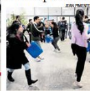
COM BARULHO Grupo ocupa prédio desde quarta para exigir melhorias no ensino. Página 12

Alunos fecham reitoria no 5º dia de protesto