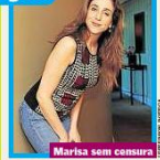
Marisa sem censura

Cala a boca, Magda! Marisa Orth diverte-se com as pessoas que ainda a confundem com Magda, sua desastrosamente personagem no extinto programa Sai do Balão (estudo até 2002). Como se prepara da ser a Magda? Que frase ela tinha para as emoções todas para fora o muita coragem, muito sexy, pouco consorte - disse ela no programa Viva Você, do canal a cabo GNT.