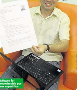
Gilvano foi reconhecido por ser específico

A psicóloga Karine Almeida, da agência Supone RH, viu os