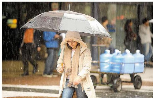
Para quem já está com a sensação de que imagens como a da foto serão para sempre, a meteorologia promete: vem aí tempo seco e frio. Página 26