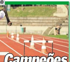
Campeões na vida

Campeões na vida Um grupo de jovens de Porto Alegre está se preparando para uma viagem de estudos e trabalho para o exterior. O grupo é composto por cerca de 10 jovens, que serão enviados para um curso de idiomas e trabalho em um país estrangeiro. O curso será realizado em um país desenvolvido, com o objetivo de proporcionar aos jovens uma experiência de vida e trabalho no exterior.