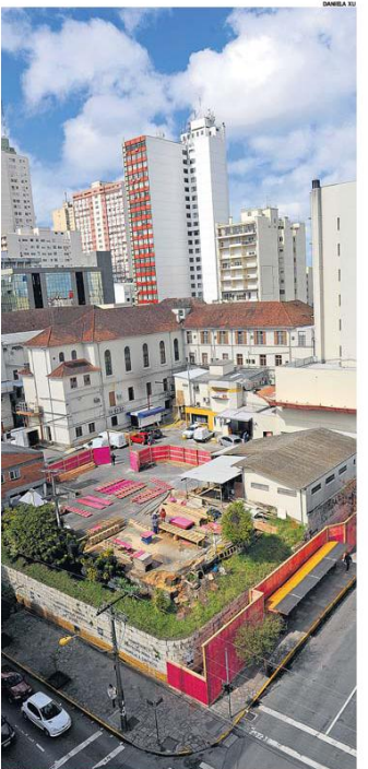
PIONEIRO COM MARECHAL Torre de 11 andares está sendo erguida aos fundos do mais antigo hospital de Caxias do Sul.