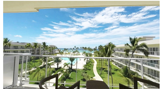
Vista del Westin Resort Punta Cana desde uno de sus balcones.

El mandatario recibió la invitación oficial de parte de una delegación de la Sociedad Dominicana de Diarios que lo visitó el 16 de agosto en su despacho. (Más en la página 2)