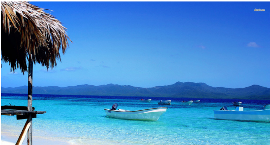
Punta Cana, entre el mar y la montaña.