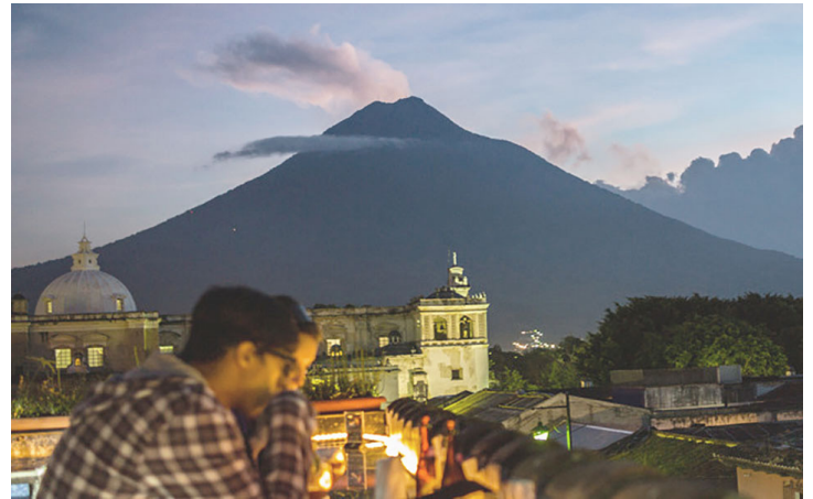
El Volcán de Agua se eleva a 3.500 metros del nivel del mar junto a Antigua.

En una entrevista con el Buenos Aires Herald , el diario en inglés que él mismo dirigió y donde hizo sus