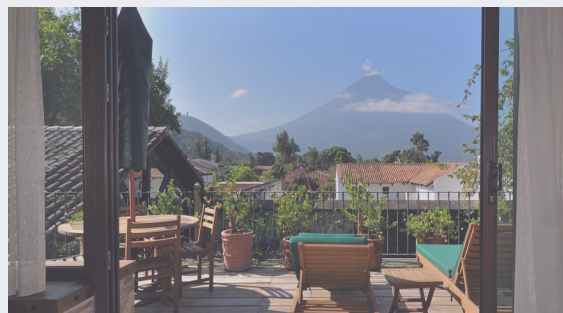
Vista del Volcán de fuego desde una terraza del hotel Casa Santo Domingo en Antigua, Guatemala.

La próxima reunión de medio año de la SIP se realizará del 31 de marzo al 3 de abril en Ciudad Antigua de Guatemala. El comité anfitrión ha escogido dos hoteles; el Hotel Museo Casa Santo Domingo, un antiguo convento de la orden de los dominicos, como sede y, además, los participantes podrán hospedarse en el Hotel Camino Real, de estilo colonial, a pocas cuadras de distancia. La 60 Asamblea General de la SIP se realizó en el 2004 en esa misma ciudad, uno de los principales centros turísticos guatemaltecos a 25 kilómetros (16 millas) de la capital. Hace 37 años Antigua fue declarada Patrimonio de la Humanidad por la UNESCO. ■