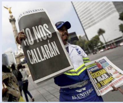
Un voceador ofrece el diario El Universal en Ciudad de México.